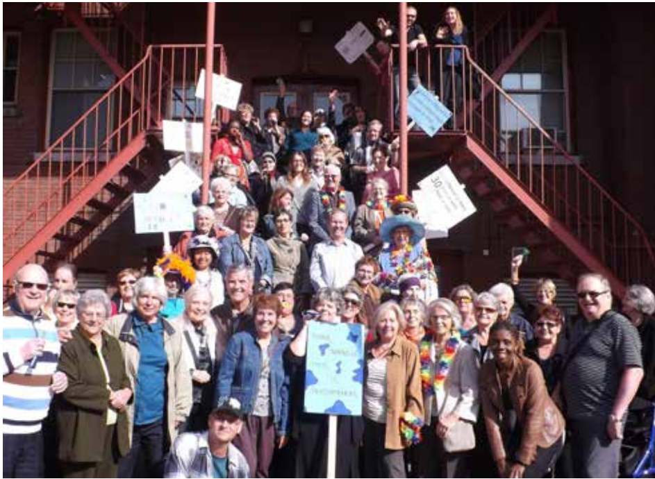
À la fête des aînés d'entraide Ahuntsic-Nord 2013