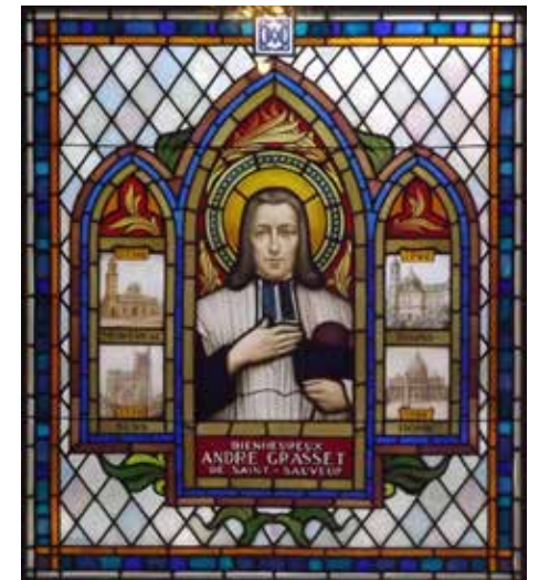
Verrière au collège André-Grasset