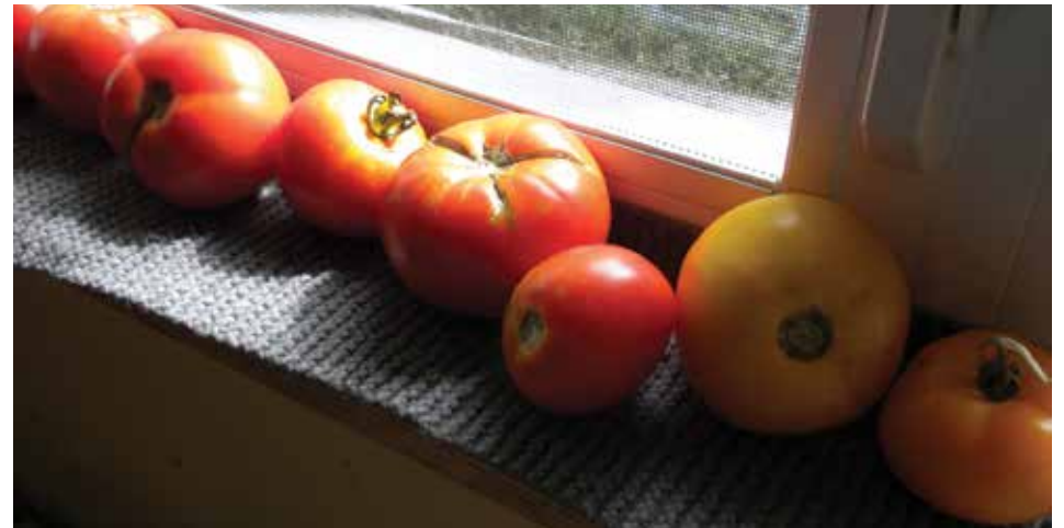
Foulard «maison» pour faire mûrir les tomates sur le rebord de fenêtre...

Alors avant de les acheter ou de les offrir, ne devrions-nous pas nous poser quelques questions et mieux évaluer nos vrais besoins : cet objet est-il vraiment utile et même indispensable? Puis-je utiliser autre chose que je possède déjà pour répondre à ce besoin? Puis-je me procurer un objet pouvant servir à plusieurs usages ou qui, après, aura une deuxième vie?