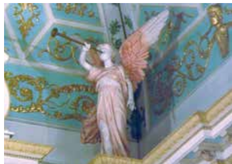
Le chérubin et les dorures au plafond sont l'oeuvre de David Fleury

À remarquer également, des portes sculptées (en 1771-72) uniques au Canada, faites par l'artiste Liébert, l'autel fait par l'artiste Quévillon, le plafond ainsi que d'autres œuvres faites par nul autre que David Fleury (dont la rue Fleury porte le nom).