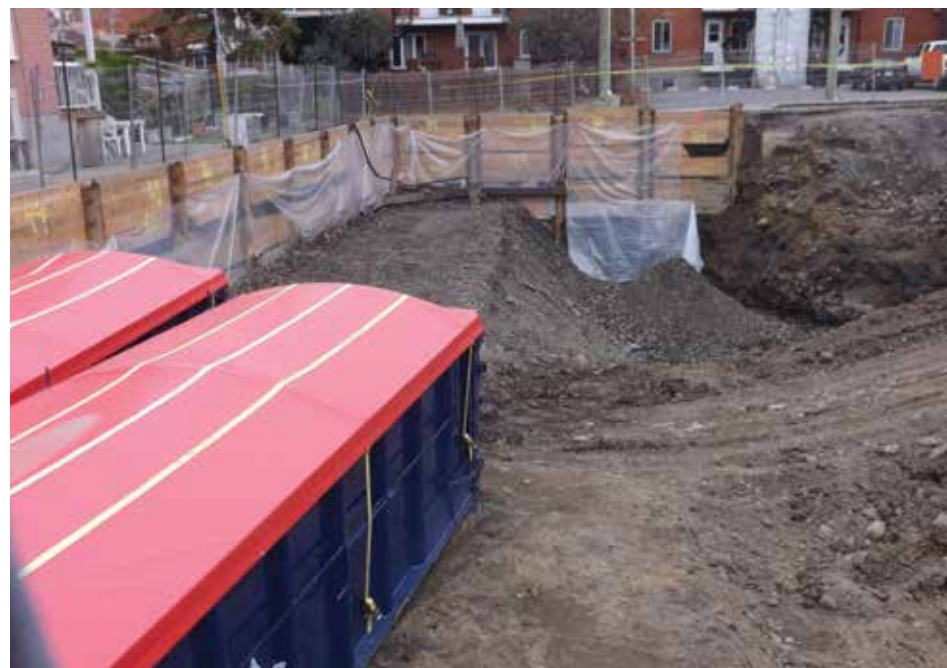
Après les travaux de creusage et décontamination, les ouvriers ont commencé à remplir le trou - (Photo : Philippe Rachiele)

Une rumeur veut que ce soit la pétrolière Shell qui défraie les coûts de la décontamination, ce qui n'avait pas été confirmé par la compagnie au moment d'aller sous presse. (Par Rabéa Kabbaj et Christiane Dupont) jdv