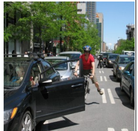
Illustration du site Web du SPVM Voir article sur le sujet dans ruemasson.com , un autre journal hyperlocal de Montréal, à : http://ruemasson.com/?p=17036

Paul Fournel, Besoin de vélo , Seuil, 2002.