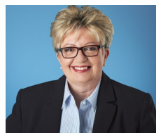
Diane De Courcy

Députée de Crémazie Ministre de l'Immigration et des Communautés culturelles Ministre responsable de la Charte de la langue française